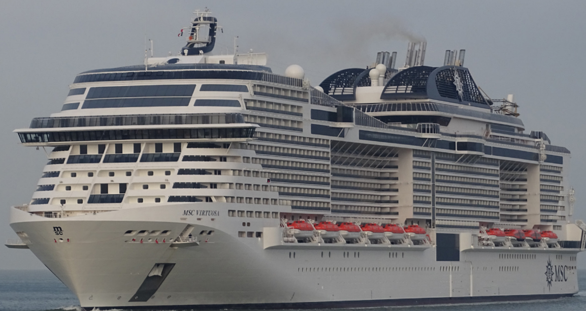
Arrivée inaugurale du MSC VIRTUOSA au Havre © Jean-François BOUGON